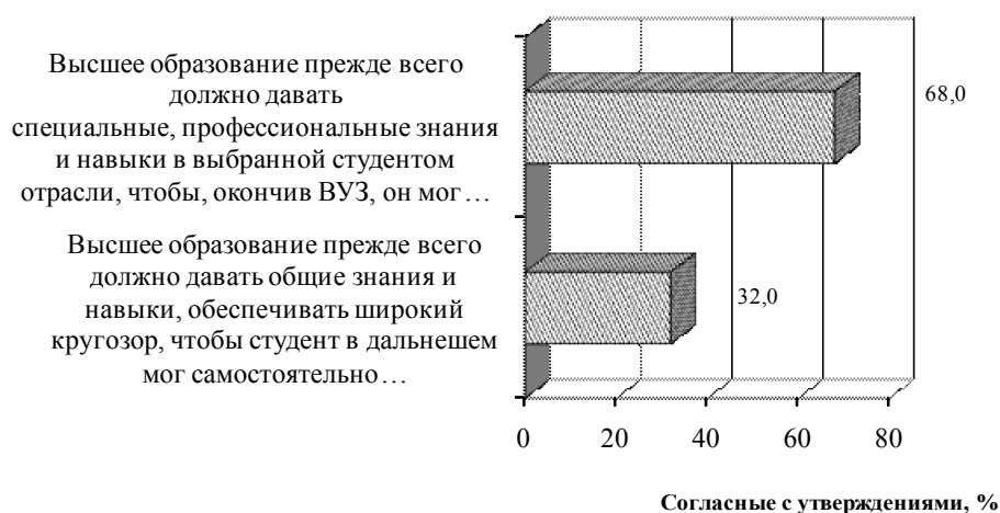
Рис. 1. Распределение населения относительно подходов прагматизации и гуманитаризации (диаграмма составлена автором на основе данных работы [9])

Как показывают исследования, у более образованных людей больше шансов найти работу и, если они экономически активны, меньше шансов остаться безработным. Однако помимо образования для благополучия человека необходимы такие факторы, как обладание правами человека и гражданскими свободами, хорошее состояние здоровья, чистая окружающая среда и личная безопасность.