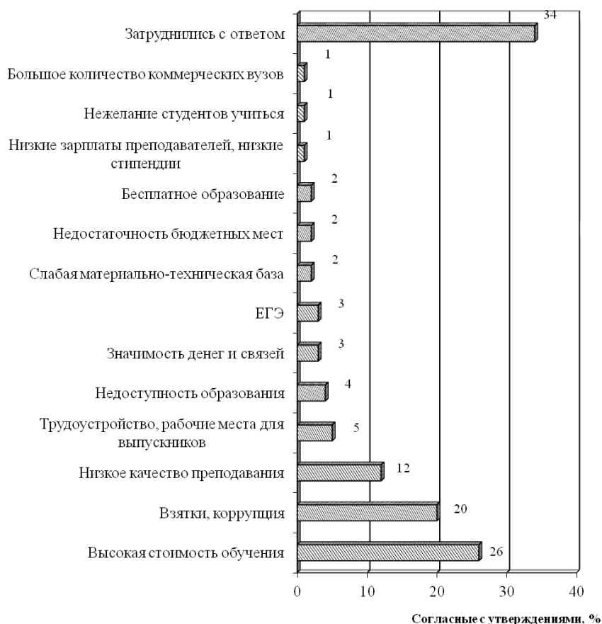
Рис. 4. Основные проблемы высшего образования в России, в %, 2011 г (диаграмма составлена автором на основе данных работы [9])

Во многом это определило высокий уровень коррупции. Взятки широко распространены как на этапе поступления в вузы, так и в процессе учебы. Такое положение дел в высшей школе влечет за собой не только моральные издержки, но и экономически дискредитирует диплом вуза, заставляя потенциального работодателя сомневаться в честности получения диплома. Снижается рыночная оценка вузовского диплома — разрыв среднего уровня зарплаты выпускников вузов и работников без высшего образования постепенно уменьшается. Это подтверждается и опросами среди населения. Так, 51 % опрошенных в рамках исследования ВЦИОМ согласны с утверждением, что «значимость высшего образования часто преувеличивают, в наше время и без него можно сделать удачную карьеру и устроить свою жизнь».