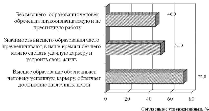
Рис. 3. Согласие респондентов с указанными высказываниями, в %, 2011 год (диаграмма составлена автором на основе данных работы [9])

Отметим, что практически невозможно измерить качество высшего образования напрямую. Распространенные в данном случае тестирования студентов и выпускников вузов проводятся нерегулярно и с применением различных методик, что в дальнейшем затрудняет сопоставимость результатов. Помимо этого, данные процедуры крайне необъективны.